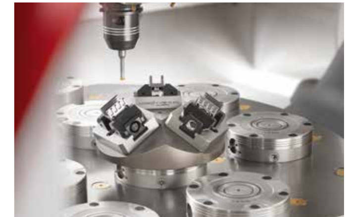
Esecuzione di scanalature con TENDO E compact